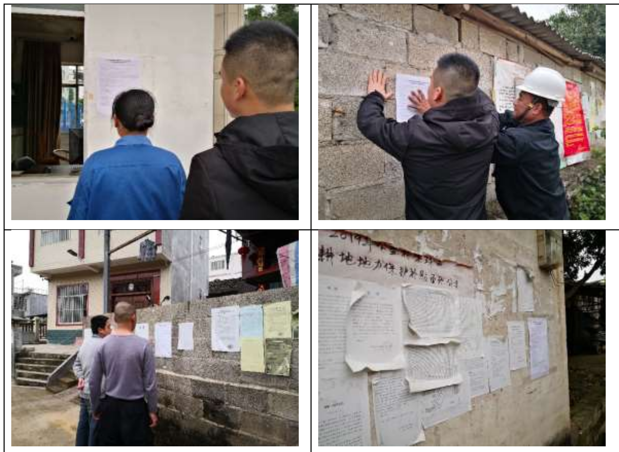
图 3.2-4 公众意见征求稿现场公示

建设单位 2020 年 3 月 20 日在评价范围内卜利屯、渠珠屯等村屯公示栏及项目工厂大门等项目环境敏感范围居民点进行征求意见稿现场公示，张贴地点均为本村屯公告栏，方便村民查阅本次公示信息。详见图 3.2-4