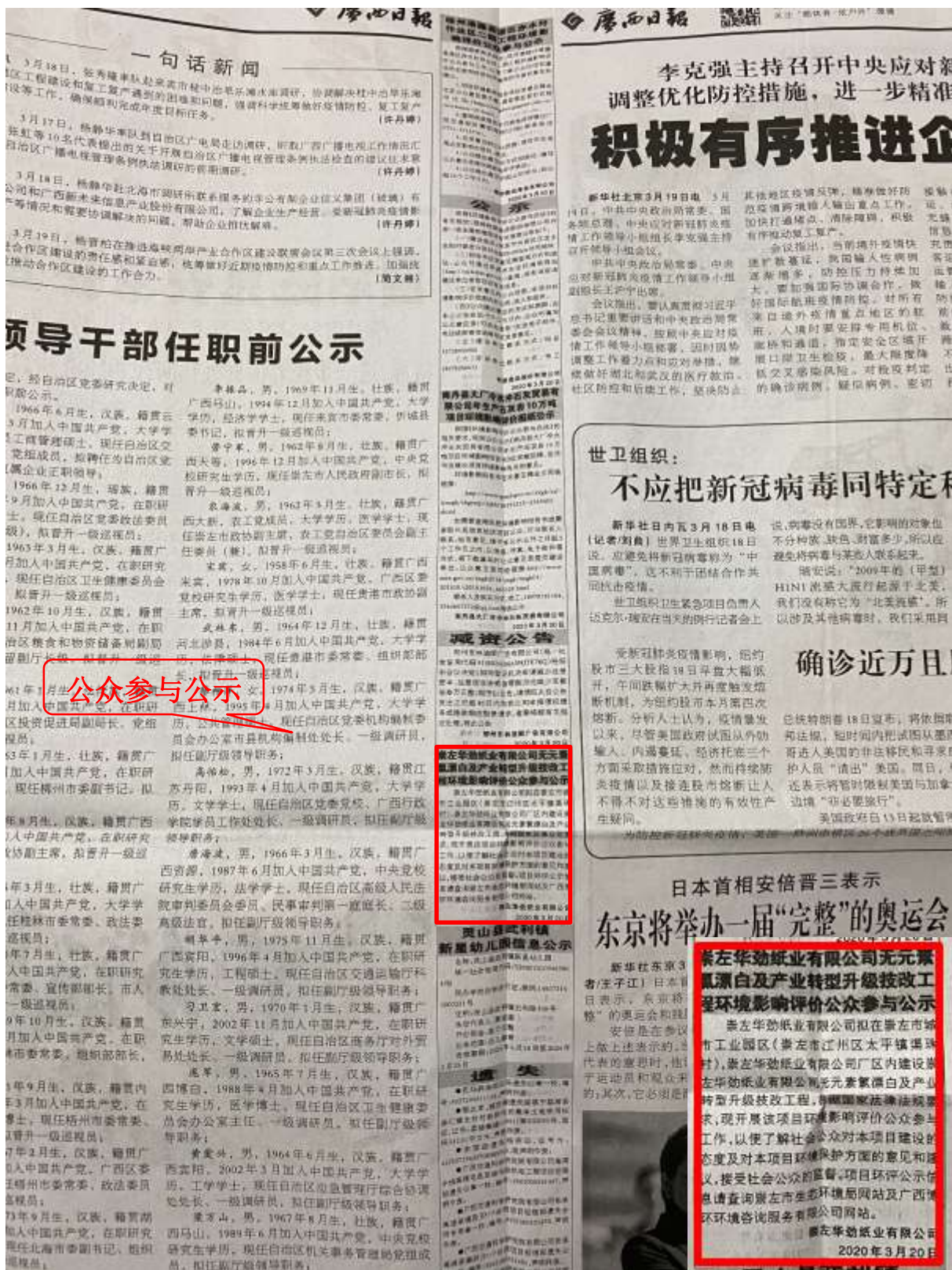
图 3.2-3 环境影响评价公众参与报纸公示 (2020.03.20)