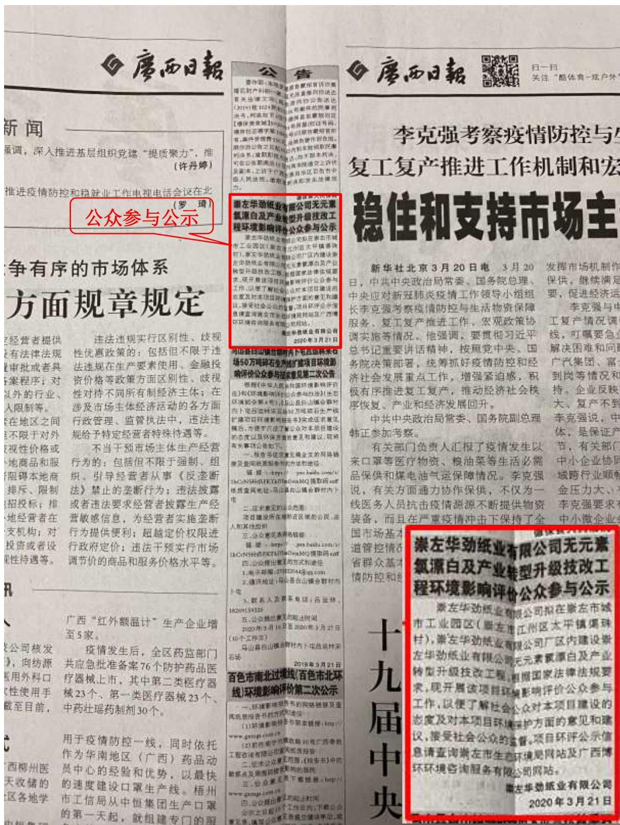
图 3.2-4 环境影响评价公众参与报纸公示（2020.03.21）