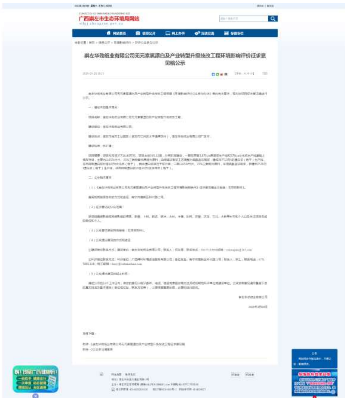
图 3.2-2 崇左市生态环境局网站征求意见稿公示截图