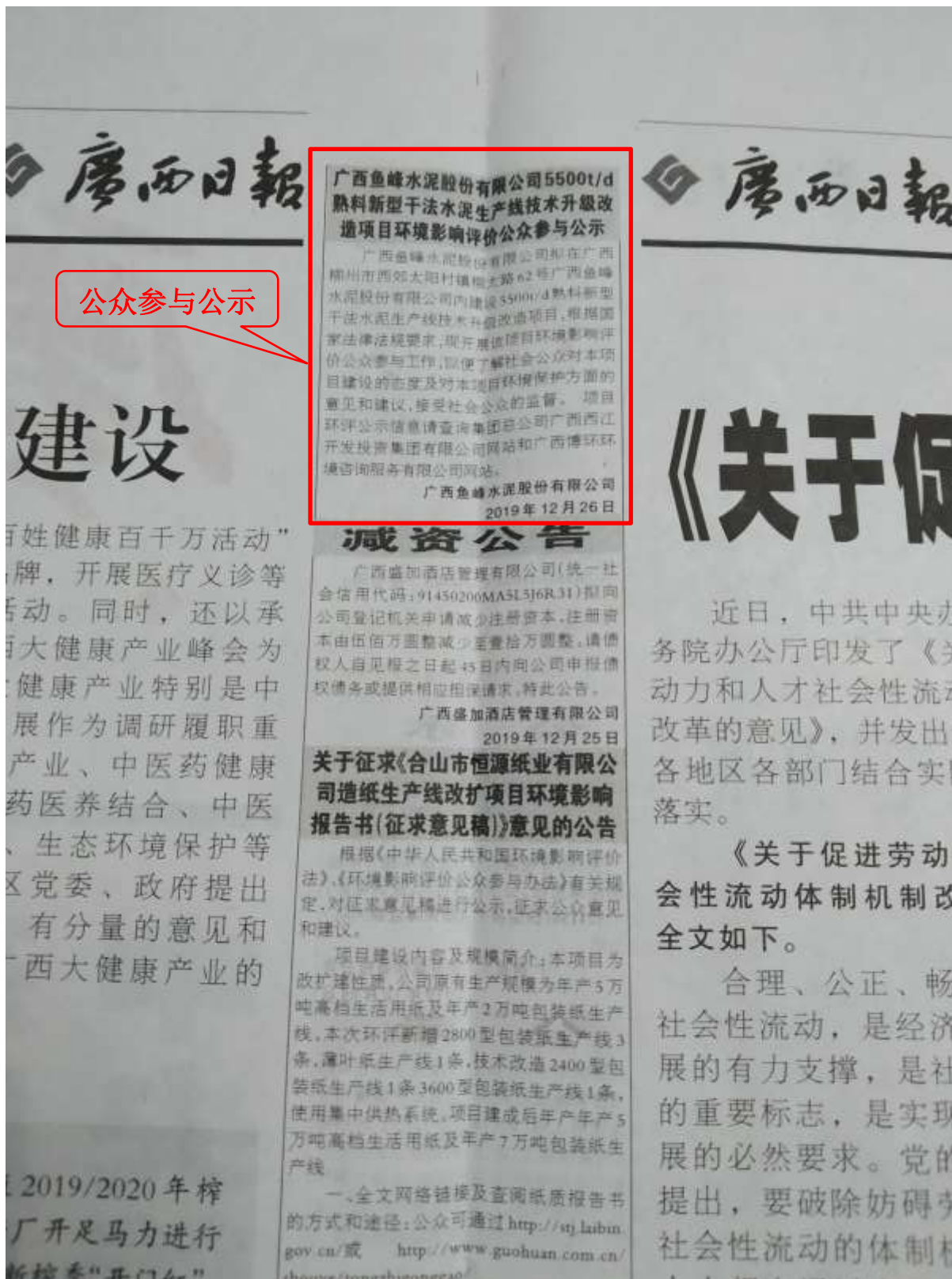
图 3.2-4 环境影响评价公众参与报纸公示 (2019.12.26)