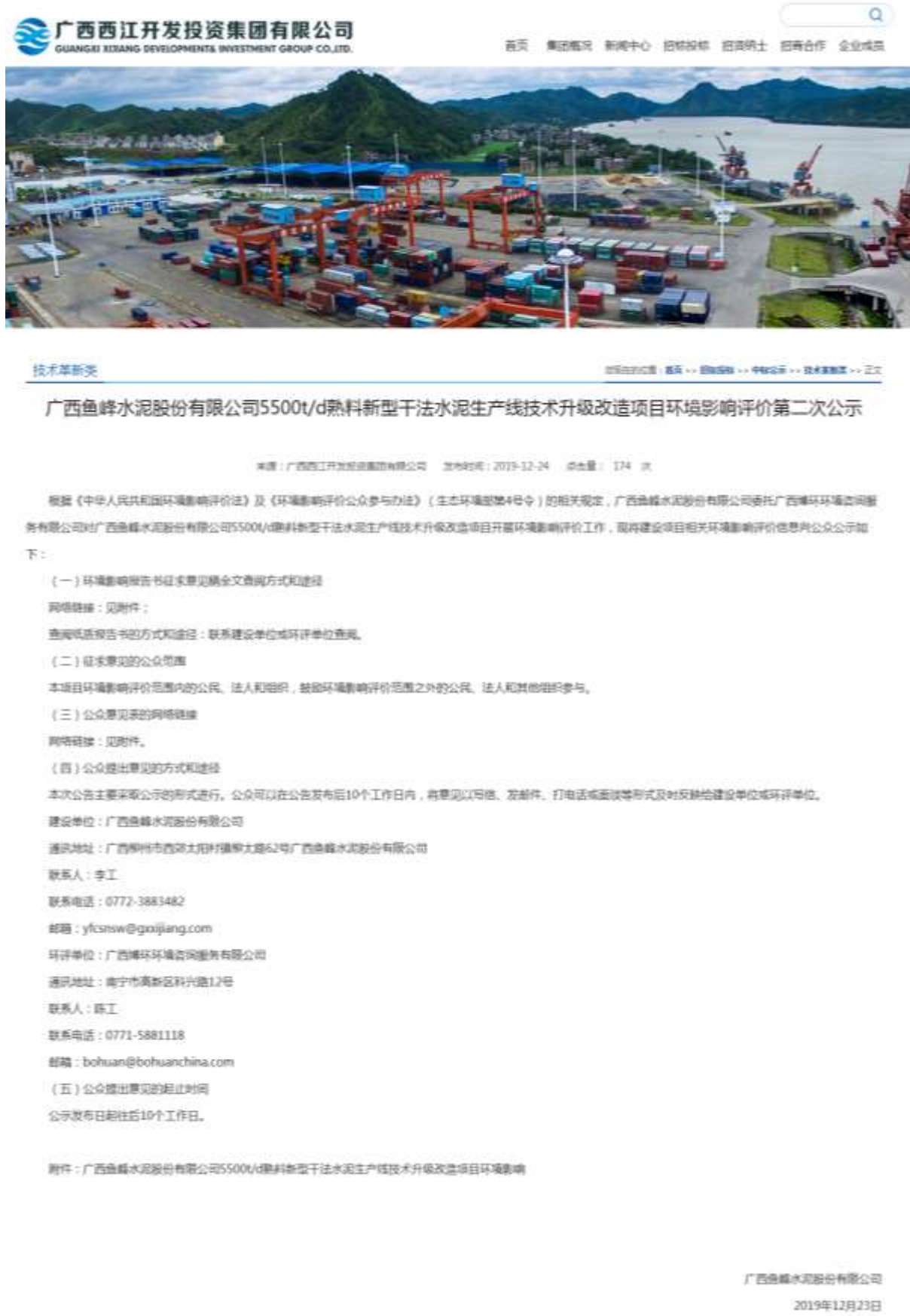
图 3.2-2 广西西江开发投资集团有限公司网站征求意见稿公示截图