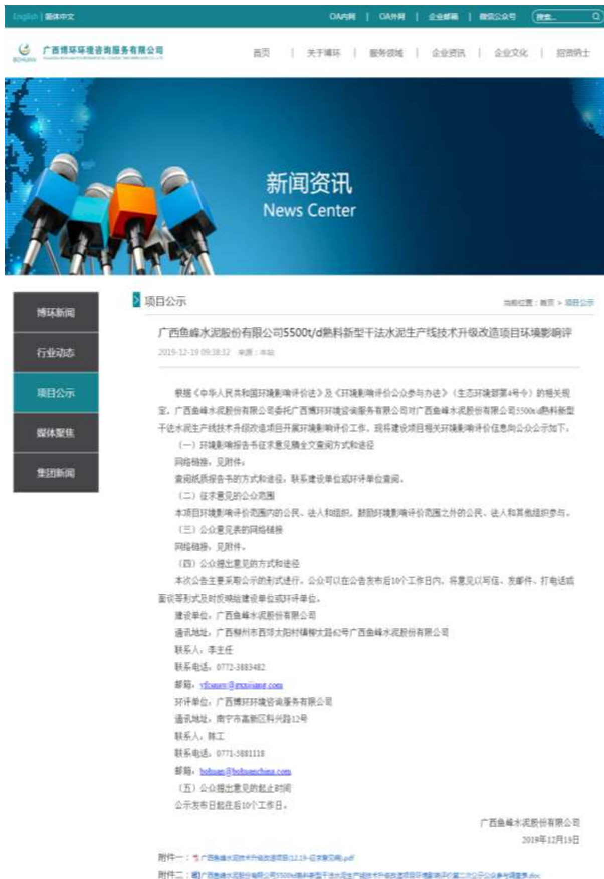
图 3.2-1 广西博环环境咨询服务有限公司网站征求意见稿公示截图