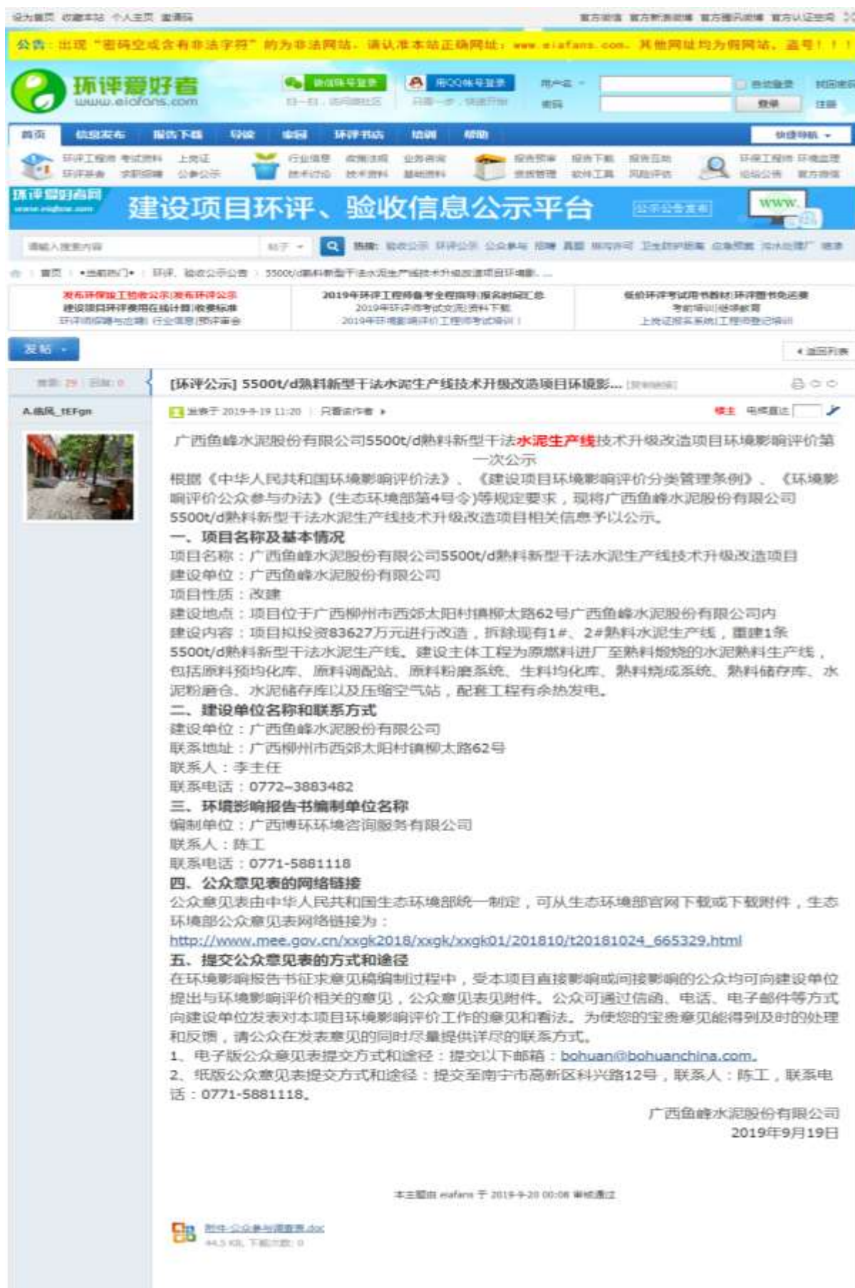
图 2.2-2 环评爱好者网站环评公示版块环境影响评价信息公开截图