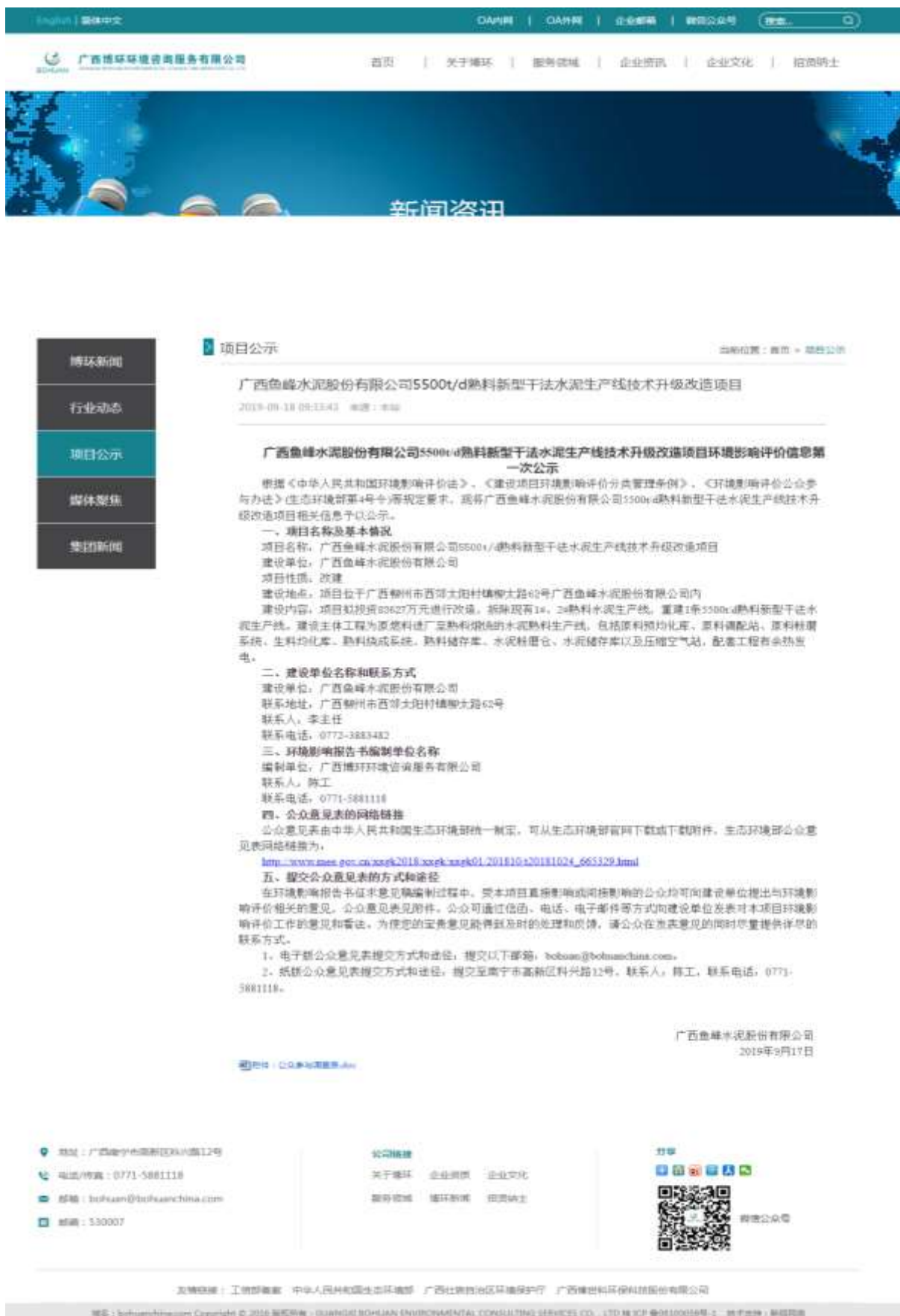
图 2.2-1 广西博环环境咨询服务有限公司官网首次环境影响评价信息公开截图