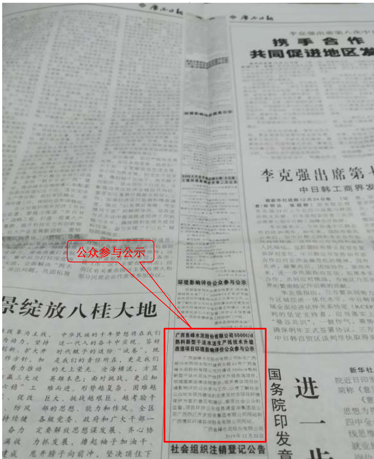
图 3.2-3 环境影响评价公众参与报纸公示（2019.12.25）

为了广泛征求公众对本项目建设的环保意见和建议，建设单位于 2019 年 12 月 25 日及 12 月 26 日，在广西主流纸媒《广西日报》上对本项目环境影响评价信息进行了登报公示。该报纸有较大发行量，受众面广，是本次公众参与调查良好的传播载体。详见图 3.2-3、图 3.2-4。